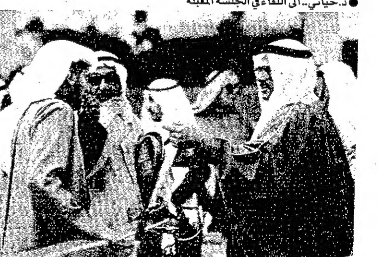
وزير العدل في حديث مع مناور